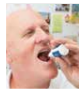
ENKELT: Tre dråper under tunga fem ganger om dagen gjorde underverker.